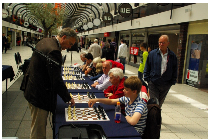
Simultaan Hans Böhm Winkelcentrum Presikhaaf 2012