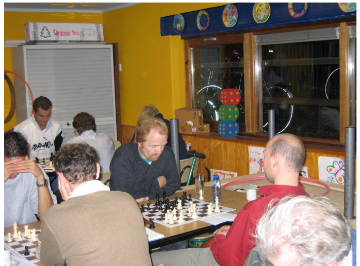
Interne in scoutinggebouw 1

Althans dat was de afspraak. Toen het bestuur van ASV de plattegrond met de gewenste tafelopstelling bij de beheerder van het gebouw aanleverden, kregen we de boodschap dat de Scoutingvereniging geen vrijwilligers had weten te vinden en dat we zelf de zalen maar moesten klaarzetten. Die mededeling zorgde voor een flinke scheur in de samenwerking met de Scoutingvereniging. Niet op het persoonlijke vlak. Daar klikte het prima, maar