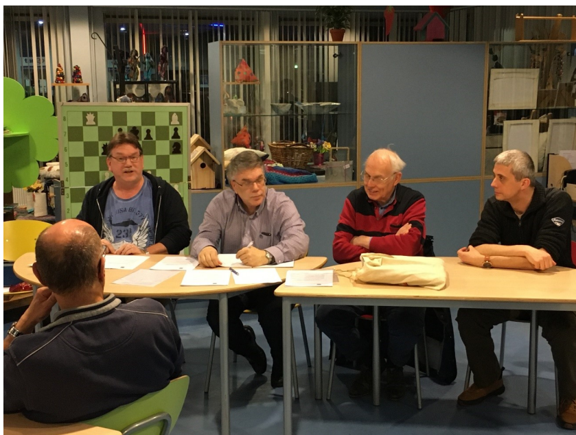
ALV 6 februari 2020