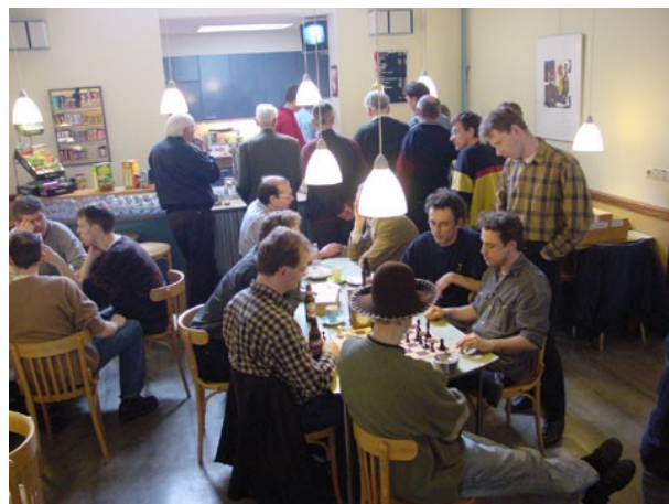
Bar in De Opbouw