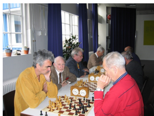
Start Daglichtschaak 2004