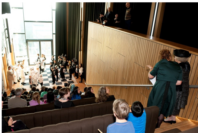
Levend schaak bij opening Rozet onder toezien oog van Prinses Beatrix - 2013