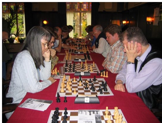
OSBO snelschaak voor clubteams 2004