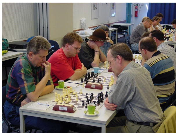
ASV 2 in De Opbouw