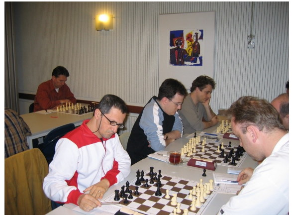
Interne competitie in De Opbouw

Voor schakers is het wensenlijstje niet zo spectaculair. Het probleem was echter dat geen enkele verhuurder van zalen ervaring had met schaken en schakers. En dan heb je al snel verschil van inzicht als het om licht, geluid, maar ook om de eindtijd gaat.