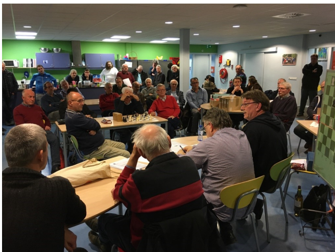
ALV 6 februari 2020