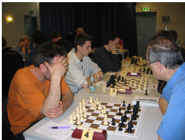
ASV 1 in De Opbouw

Een hectische periode volgde. Allereerst was er het juridische aspect. ASV had een huurcontract, dat jaarlijks op 18 augustus stilzwijgend met een jaar verlengd werd. Ook stond in het huurcontract dat Rijnstad drie maanden voor die datum beëindiging van het huurcontract schriftelijk moest aankondigen. Dat was niet gebeurd. Uiteindelijk werd in pais en vree overeengekomen dat ASV na het seizoen 2003-2004 De Opbouw zou verlaten.