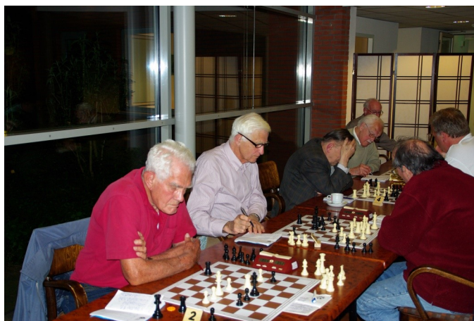
Gemeenschappelijke slotronde veteranenteam 2009