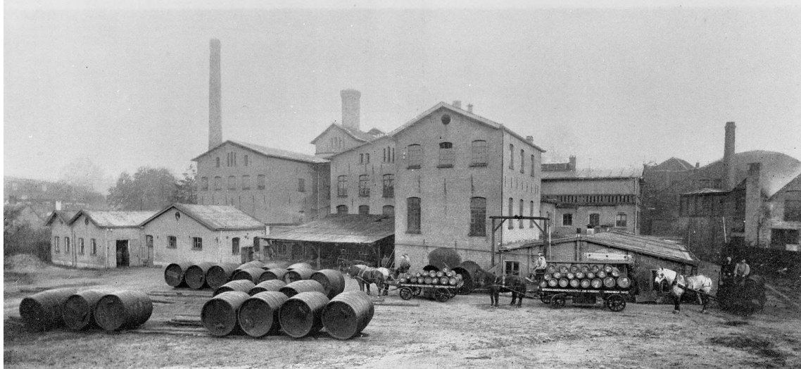
Gezicht op de Brouwerij (Zuidzijde).

Het clublokaal van de schietvereniging bleek over een uiterst gezellige kantine te beschikken. Buiten dat de toegankelijkheid een ‘no go’ opleverde, was ook het licht nog eens heel slecht. En dat is alleen een voordeel als je net een slechte zet gedaan hebt. We vonden het jammer dat er zo geen samenwerking met het andere ASV mogelijk was, want we voelden ons enorm welkom. Vol goede moed reden we door naar het volgende adres. Dit-