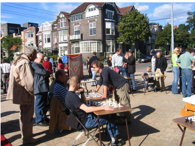
Opening Jansbeek 2005