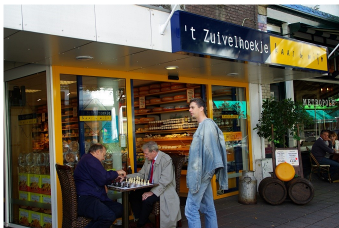
Demo Steenstraat 2009