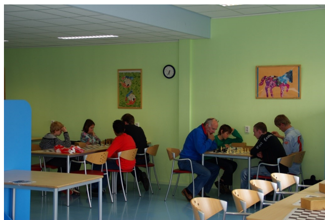
Jeugd in Schreuder