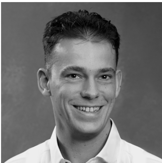
Alje Bolt op LinkedIn

Wil je mijn verslag nog lezen voordat het in ASV-Nieuws komt? Nee, is niet nodig.