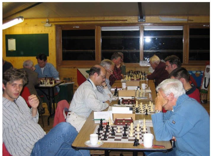
Interne in scoutinggebouw 2

Het Scoutinggebouw was inmiddels logischerwijze ook als scoutinggebouw ingericht. Attributen als totempalen, maar ook hun meubilair maakte de beschikbare ruimte kleiner. De bovenverdieping was bovendien gehalveerd om de kantine te kunnen creëren. We wisten dat die ingreep zou gaan plaatsvinden, maar het viel ons toch tegen hoeveel ruimte om te schaken hiermee verloren ging. De eerste avonden richtten we zelf de speelzalen in. Dat was een heel gesjouw. Er was namelijk alleen opslagruimte op de bovenverdieping en de benedenverdieping en juist de middelste zaal bleek de voorkeur te hebben van de meeste schakers. Het sjouwen van de zware tafels door het trappenhuis was geen pretje, maar gelukkig hadden we dat vanaf de derde clubavond uitbesteed.