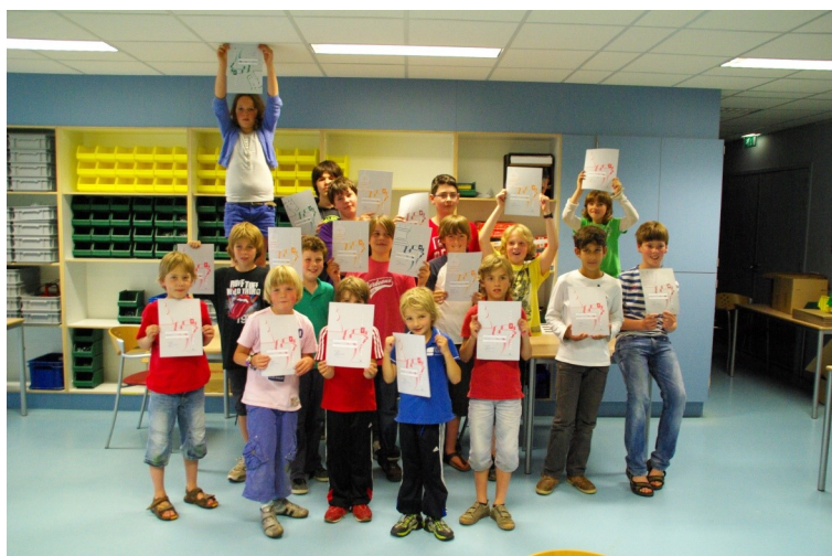
Examen stappenmethode jeugd 2012