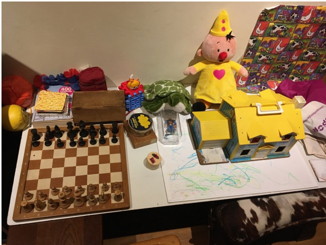
Nu met eigen schaakbord 30 september 2022