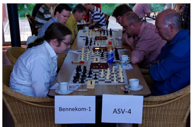
OSBO-cup finaledag 2008