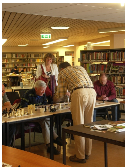
Schaakmaand in Bibliotheek 2011