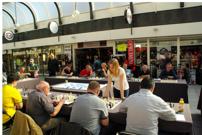
Simultaan Anne Haast Winkelcentrum Presikhaaf 2014