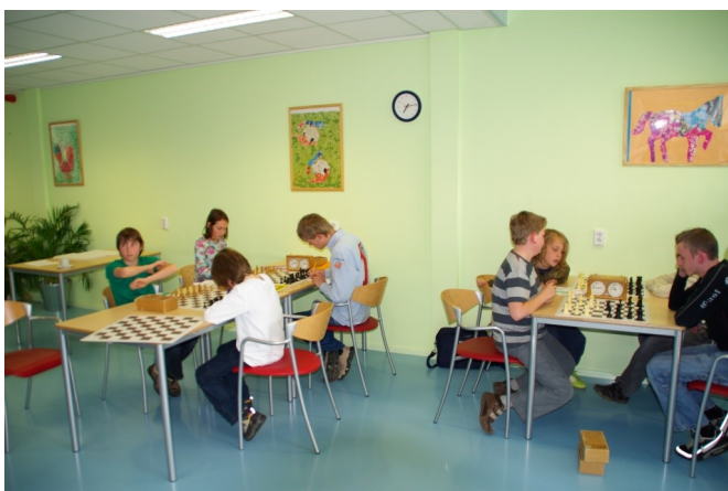
Eerste clubavond in Schreuder