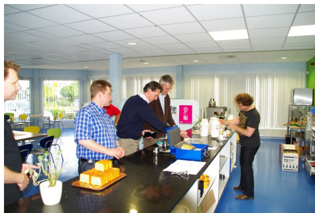
Bar in Schreuder