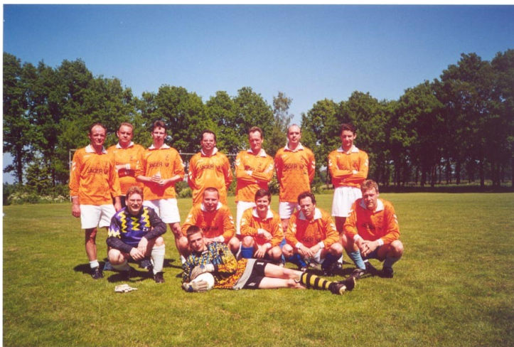
Voetbaltoernooi Wodanseck 2001

In de dertig jaar sinds 1991 heeft ASV heel veel activiteiten georganiseerd. Uiteraard veel toernooien, maar ook veel activiteiten gericht op publiciteit. Denk aan simultaans op straat of in het winkelcentrum, demo's op de Steenstraat, de opening van Rozet. Het voert te ver om alles te noemen of zelfs maar te laten zien. Verspreid over dit blad in chronologische volgorde een fotoserie van de nodige gebeurtenissen die met name de laatste 20 jaar gebeurd zijn. We hadden nog verschillende pagina's kunnen vullen.